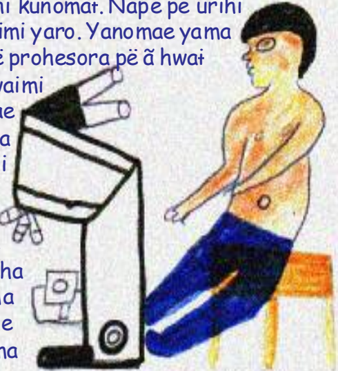
Joseca e utupë