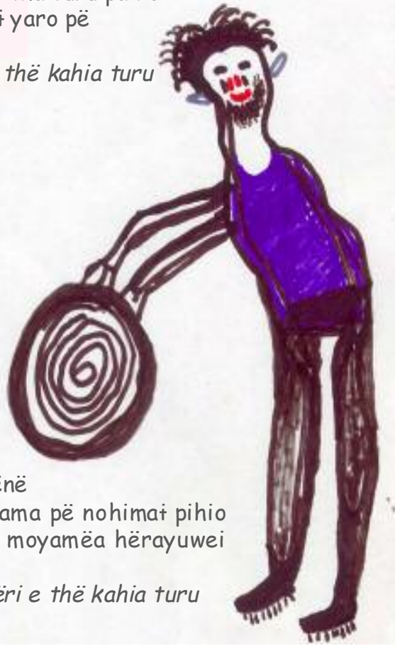
Branco Yanomama Wayohomapi thëri e thë kahia turu

noamaiwei thã turu paxio. Garimpeiro pëni yaro pë xëi yarohe yaro yama pë noamai mahi. Kami yamaki yaro yama pë noamai mahi yaro, yama pë wai yaro, yamaki pitiri huat yaro yama pë noamai mahi paxio. Yaro yama pë noamai ma tëhë yamaki ohirayu. Garimpeiro pëni yamaki yaro pë haikiarihe tëhë yamaki ohirayu ta? Ya pihi ku yaro, yaro pë noamaiwei thã turu paxio yaro. Yaro pë noamaiwei thã turu paxio. Yamaki yaro pë maprario tëhë yamaki naikirayu. Maprarioma.