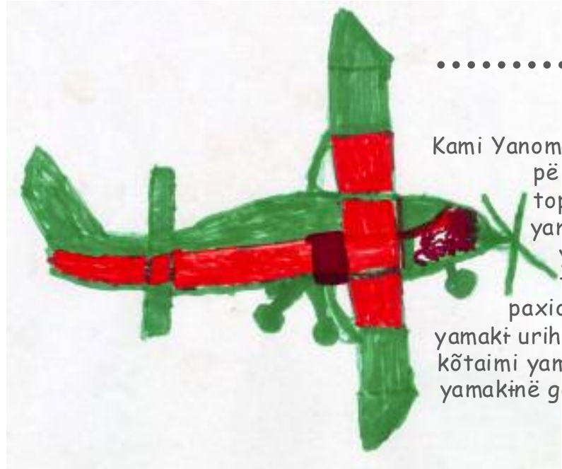
Tomé Yanomama Wayohomapi thëri e thë kahia turu

Kami Yanomama yamaki ria ha hirimamonë Posto yama a thamai thi yanoha yamaki ria ha hirimamonë napë yama pë nosiamai yaro Yanomama yamaki Posto pë yai yaro yamaki hirimamouwei yano yaro yamaki pihi yai topraru mahi. Ehi yano maa tëhë yamaki yai nomapru kôki ta? Ya pihi ku yaro kami yamakinë Posto yama a thamakawei thë ã turu paxio. Ehi yanoha yamaki ra kãyo hirimamuwei yano yaro yamaki pihi yai topraru mahi. Kami yamakinë Posto yamaki pihi yai topraru mahi kami Yanomama yamaki raamu tëhë yamaki harouwei thi yano paxio yaro. Awei, hapa tëhë pata thë pë yai nomapruwei thã turu paxio. Hapa mahio tëhë garimpeiro pë ma tëhë Yanomama yamaki yai urhipë auwoma maki garimpeiro pënë yamaki urihi pë xamimararema yaro thi tëhë kami Yanomama yamaki yai nomaokema yaro hei tëhë garimpeiro yama pë nohimai pihio kôtaimi yamaki urhipë yai wariat mahiopru yaro yamaki pihi yai xuhuri mahi. Kua yaro kami oxe yamaki pihi yai moyamëa hërayuwei yamakinë garimpeiro yama pë nohimai pihioimi yaro inaha kôrema inaha ipa thë ã turu kutaoma.