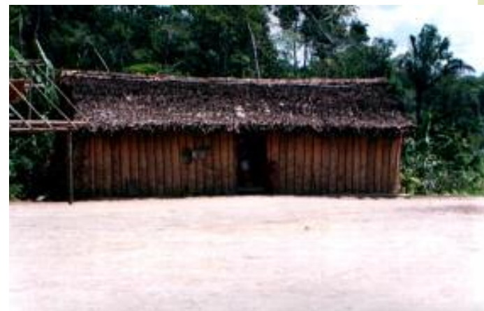
Hapa Bicho Mirim hami yamaki warokema