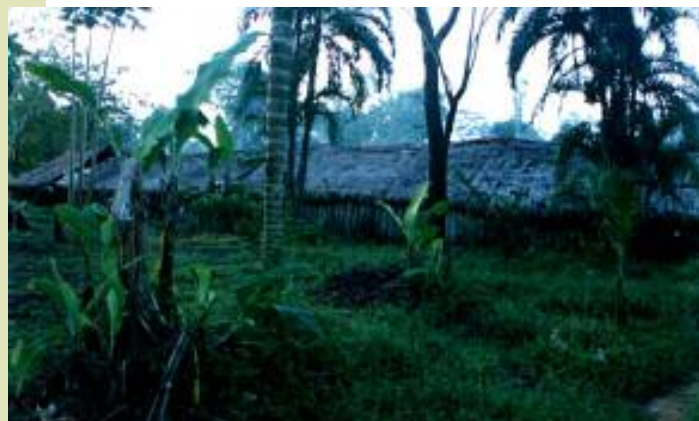
Ixima u teri pë xaponopi