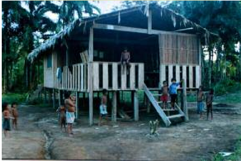
Hei esikora aha Ixima u teri pë hiraiwei

Awei. Kamiyë ya rë kui inaha ya puhi kuu. Kamiyë yamaki rë kui professor Yanomami yamaki kuprou yaro kamiyë ya xi toprarou. Awei. Inaha ya kâi puhi kuu. Hëyëha Ixima të ha professor yamaki yai kôkaprarioma yaro hei tëhë yamaki moyawëprariyoma. Awei, inaha të kâi kua. Hapa hëyëha yamaki estudamonowei inaha professores pë kuoma: Pukima, Parawa u, Ajuricaba, Ixima, escola