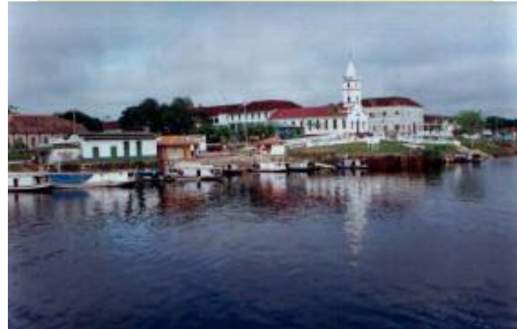
Hei sitate a rē kui, Barcelos , napē pē pēriowe kupe

Weti naha yamaki kuwaapë ta? Wamaki puhi kunomai. Professor pëmaki yaro pëmaki nakayou pëmaki warii tēhē xaari wama tē pē oni tapē. Weti naha wamaki onotaita napē pē puhi kuu yaro. Wama tē oni taprai mao tēhē, exi tē ha? Wa hupē napē pē puhi kuu. Kama wamaki yahipi há wama ki xowao tēhē wamaki puhi xaariproimi kamiyē ya xowao ma rē mai. Ya puhi xaariprou puhio mahi yaro.