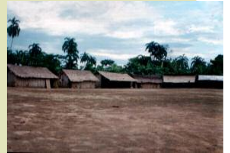
Missão Marauia Yanomami no motahawë pë perïowei