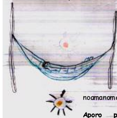
Aporo professor yanomami

Fundacao Nacional de Saude diheiro yama a noamai mao tëhë weti naha yama ki kuwa a pëta. dinheiro yama a yai pata noamait mao tëhë yama kino preaai. Yama a yainoamait, yama ki nomait puhioimiyaro. Yama a noamait, remedio ki kuamao tëhë pneumonia wayu maipëomi. Remedio kini a wayuxiro nomait. Malaria akai wayukuprario, remedio kini a wayuxironomait. dinheiro waisipi yama a peximaimi. garipeiro pëkopeiyaro enahayama ki puhikuu yaro. Oni yamaa ximait mao tëhë rope garipeiro pë kopei yaro oni yamaa xima a ximait mao tëhë yama ki puhio horimorayou. Yama ki nomait puhioimiyaro dinheiro wama a noamanomai yama ki xuhurumorayou yaro. dinheiro wama a noamanomai napë pëkuomao tëhë yama kino preaai.